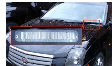
Drivers Side Door Jam